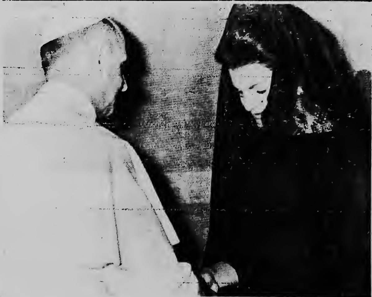
VATICANO -- Señora Jacqueline Kennedy ta ser saluda pa Papa Paulo VI durante un audiencia na Vaticano. Señora Kennedy a papia cu Papa Paulo VI riba e difuntu presidente John F. Kennedy.

Un otro turba a sende un teatro na candela y a cayanan di acceso cu tronconan y piedra pa impedi yegada di e bombaeronan. Polisnan a usa nan klop y gas lacrimogeno pa dispersa e revoltosonan.